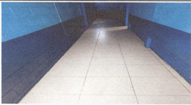
Foto 3: Se realizo la sustitución de piso ceramica del modulo II.