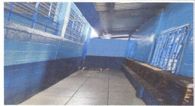
Foto 2: Se realizo mantenimiento a estructuras de metal de ventanas.